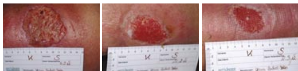
Ulcus cruris venosum mit Progredienz über Jahre

Jedes Therapieelement ist ohne die anderen Anwendungen wenig wirkungsvoll. Eine gute Koordination der verschiedenen Maßnahmen ist Voraussetzung für eine erfolgreiche Therapie. Unser Ziel ist es, Menschen mit chronischen Wunden nach neuesten Erkenntnissen und anerkannten Behandlungsstandards gut zu versorgen und die Rezidivrate, die mit über 30% sehr hoch ist, zu reduzieren. Schließlich kann durch eine erfolgreiche Wundversorgung der Patient viel an Lebensqualität und Unabhängigkeit zurückerlangen.